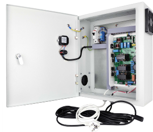
Шкаф питания на 1 ЭПРА