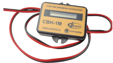
Счётчик времени наработки